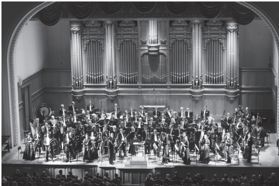
State Academic Evgeny Svetlanov Symphony Orchestra of Russia Государственный академический симфонический оркестр России имени Е.Ф. Светланова