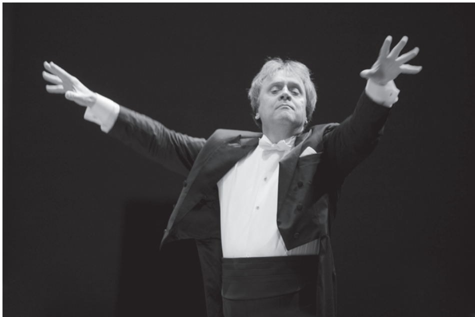
Conductor Alexander Lazarev Дирижёр Александр Лазарев